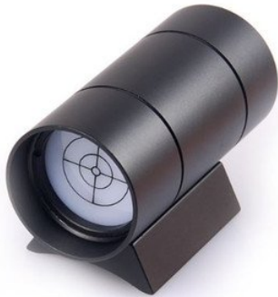
Abbildung 2: AST Sonnensucher #57929

Schwierigkeiten haben die Sonne zu finden, bieten wir in unserem Sortiment spezielle Sonnensucher an.