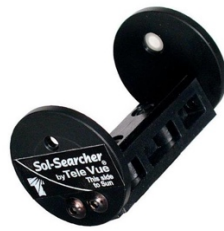
Abbildung 3: TeleVue Sonnensucher #14700