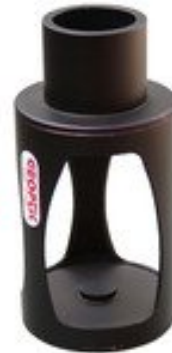
Abbildung 4: Geoptik Sonnensucher #44564

3.5 Drehen Sie den Teleskoptubus von der Sonne weg, bevor Sie den Filter am Ende Ihrer Beobachtung wieder vom Objektiv entfernen.